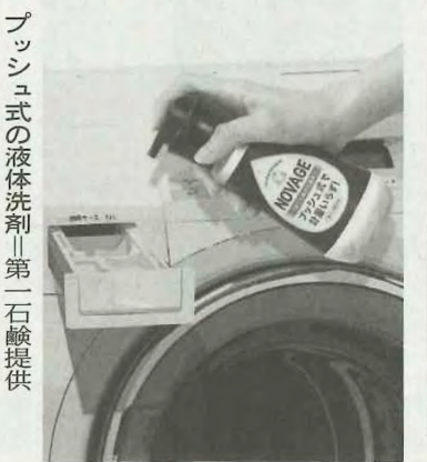
プッシュ式の液体洗剤 第二石鹸提供

が明らかになっておらうと情報は収集に全力を挙げ、今後死傷者が増える恐れがある。インドネシアでは7月未以降、西又サトゥンガ